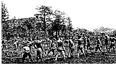
開墾作業 (昭和17~20年) 北海道へ援農作業 (昭和18~20年)